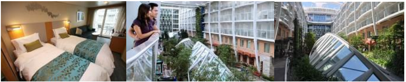
ห้องพักแบบ Inside